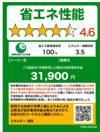
(電気温水機器のイメージ)

※照明器具、テレビジョン受信機、家庭用電気冷蔵庫、家庭用電気冷凍庫、温水機器及び電気便座については、2020年11月及び2021年8月に図5に変更済。今後、家庭用エアコンディショナーについても図5に倣ったものに変更予定。なお、温水機器以外は、製品のサイズやネット取引等の限られたスペースで使用する場合は右側のミニラベルを活用すること。