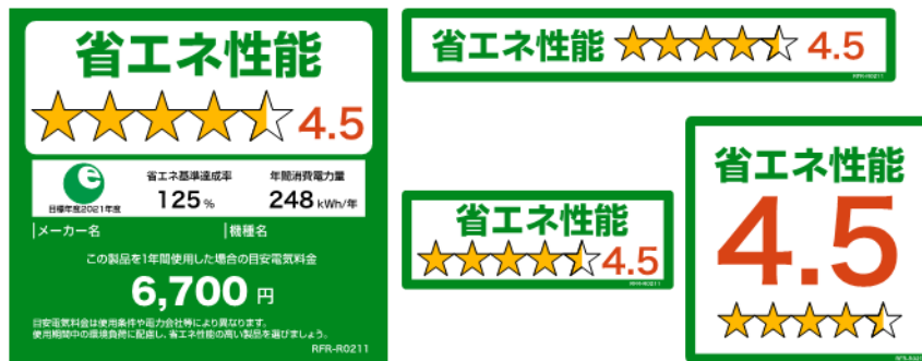
(冷蔵庫のイメージ)